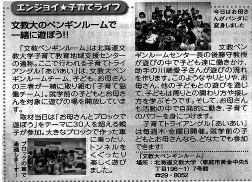
資料1 北海道新聞「るーと36」に掲載された文教ペンギンルームに関する記事