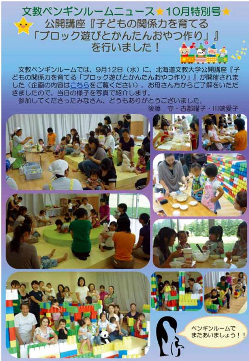
資料10 文教ペンギンルームにおける公開講座に関する情報提供 (2012年10月特別号)

で生活している親子を対象にした関係力育成プログラムに関する公開講座を実施してきた。これらの情報についても、文教ペンギンルームニュースに掲載してきた（資料10参照）。