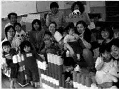
写真1. こども道を園んでほっと一体みの 子育て学生ボランティアとお母さん