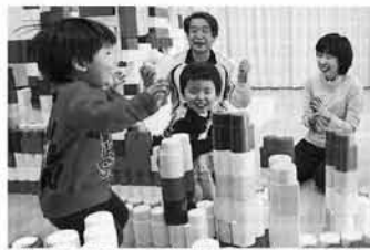
北海道文教大の子育てサロン「文教ペンギンルーム」。実学を重視した特色ある大学づくりでアピールする

「現日本の大学事情」の推移がある。文教大の「子育てサロン」は、就学前の子どもとお母さん、学生が一緒に遊ぶ場を提供している。子育て協働チームの取り組みが、道内私立大学の志願倍率や入学定員充足率に与えている。