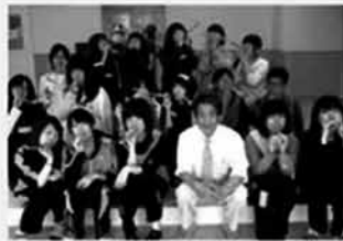
写真2. お土産の香ばしさをもらってほっと一息の 基礎ゼミの受講生と教員